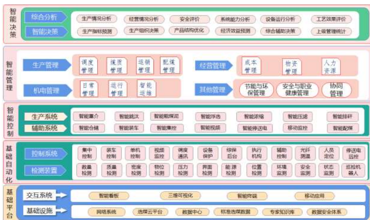
图 5-2 建设内容框图

分析与决策支持系统是人工智能与选煤专业技术的结合，包括各种分析评价与决策功能，是智能选煤的集中体现。